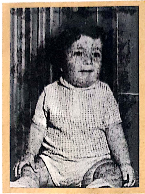
1963 - ישראל בן שנה