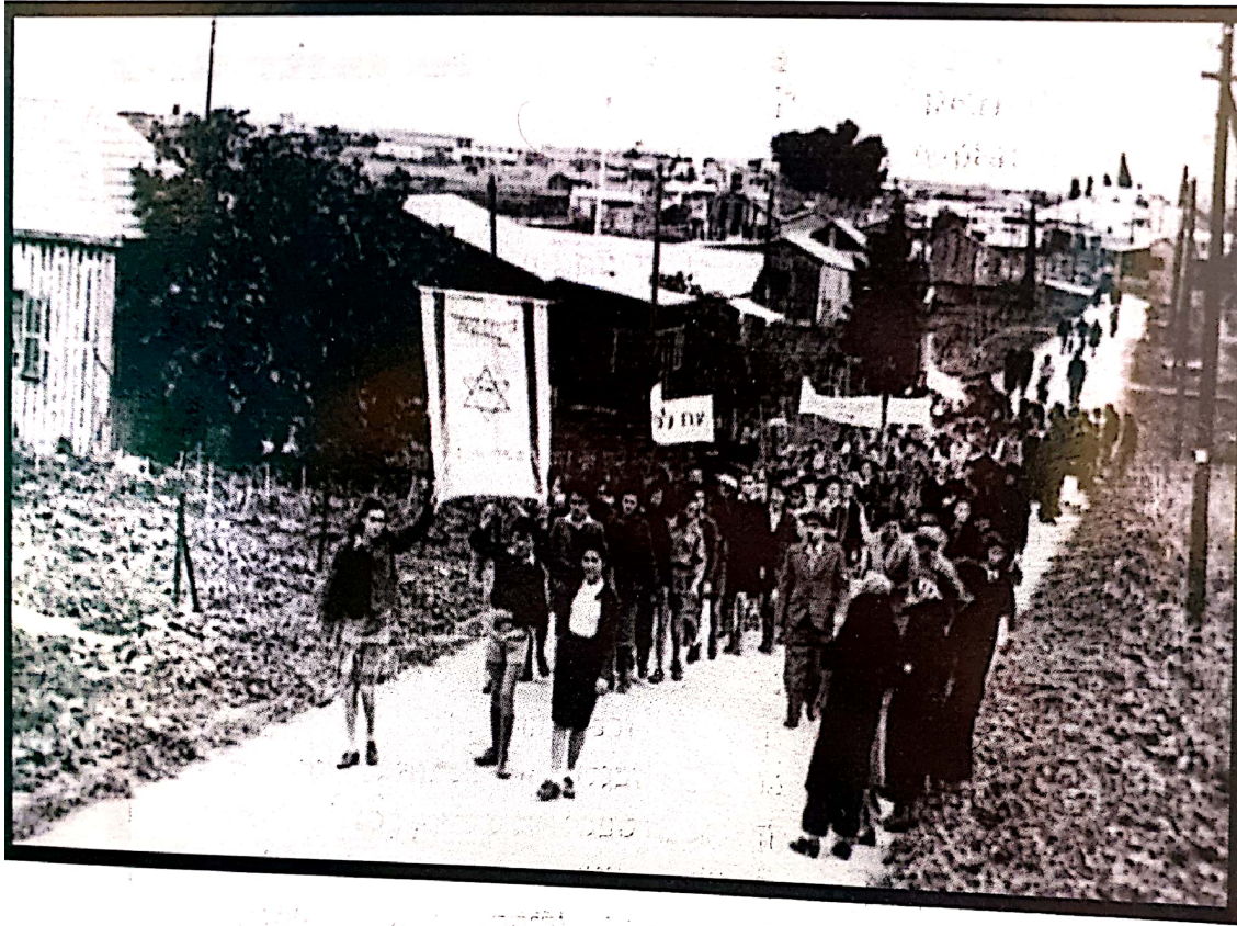
ילדי בית הספר הולכים ללימודים בדרך