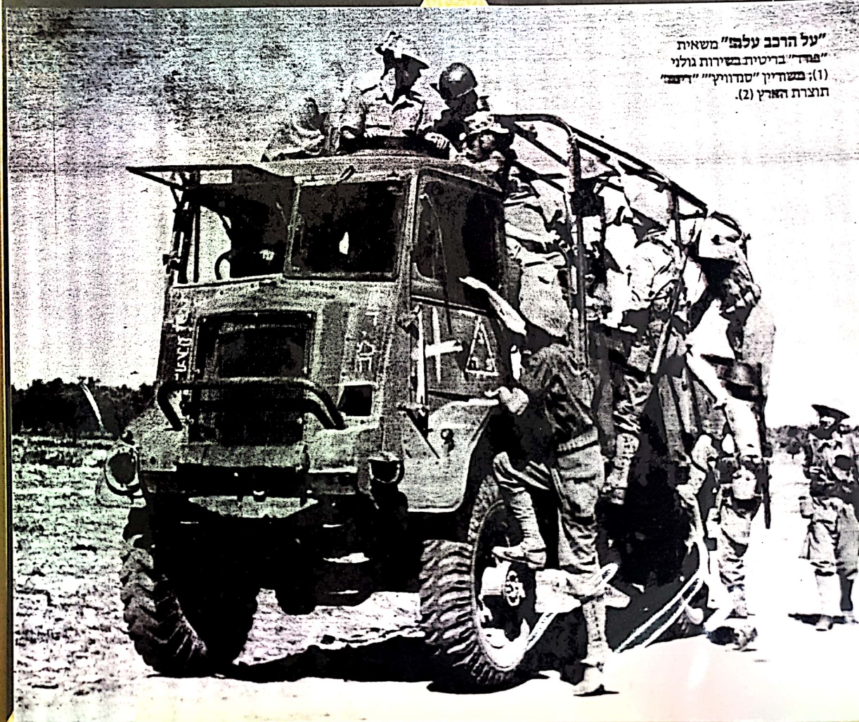
"על הרכב עלה" משאית "פפד" בריטית בשירות גולני (1); בשחיין "סנדוויץ" "דיג" תוצרת הארץ (2).