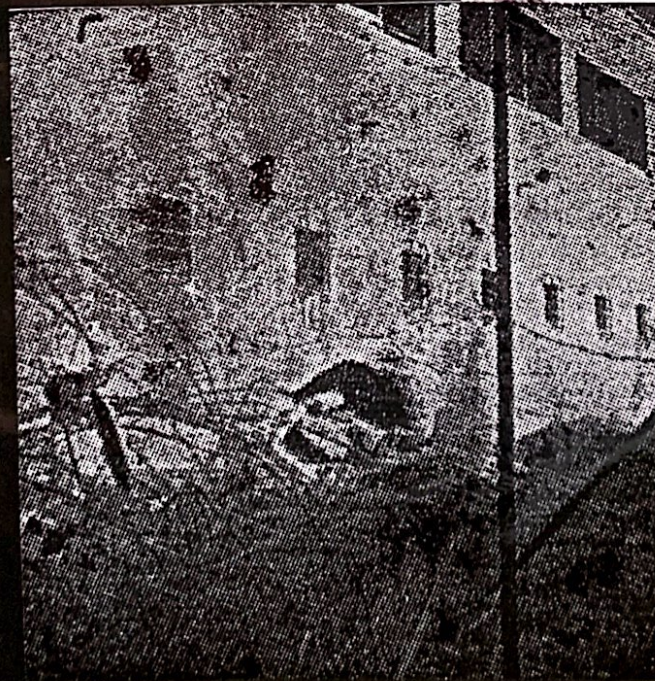
הפירצה בבנין המשטרה

מיד עם התפוצצות הגדר, התקדמנו, ועמנו שאר התרמילים, דרך פרצת הגדר והנחנו את חומר הנפץ ליד הקיר. הפתיל הוצת, ואנו נסוגנו לעבר בית-הספר. נשמעה התפוצצות. הודעתי למוטקה שעליו לצאת עם יחידתו ולפרוץ לבנין. היחידה יצאה. כעבור זמן-מה שמעתי קריאות: «אין פירצה! לסגת!» הודעתי לחבלן, שיראה ליחידה את מקום הפרצה. יחד הצטרפנו לכוח הפורץ ונכנסנו ראשונים לתוך הבנין. ראינו את הערבים יורדים במהירות ממגדל המשטרה. יריתי אליהם כמה כדורים באקדחי זורקתי רימון לעברם. מיד שמעתי את מוטקה קורא אלי: «רימון!» — הסתכלתי סביבי, אך לא ראיתי דבר, אותה שעה אירעה התפוצצות על ידנו. רפאל החבלן נפצע פצע קשה בגבו. בינתיים פרצו הכיתות פנימה וסיהרו את הבנין. ערבי אחד נהרג ואחד נשבה. השאר הצליחו להמלט. מדברי השבוי נתברר, שבמשטרה היו 25 רובאים ומקלע אחד. בלילה נדדו עוד כמה יריות מן הכפר לעבר המשטרה, אך לפנות בוקר ברחו ערביי צמח מן העיירה. אנשינו חדרו לעיירה וסרקוה. לא נמצא איש עד הקרנטינה החדשה.