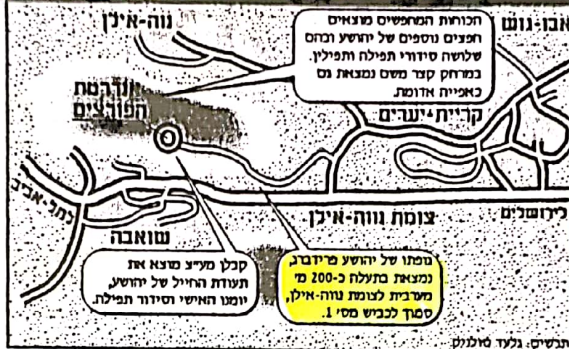
תנשים. גלעד טולנולק

דה. הם ביקשו ממפקדיהם לפתח מיד בדיפרי שים אך להרבותם, לא נלקטו מצינורות.