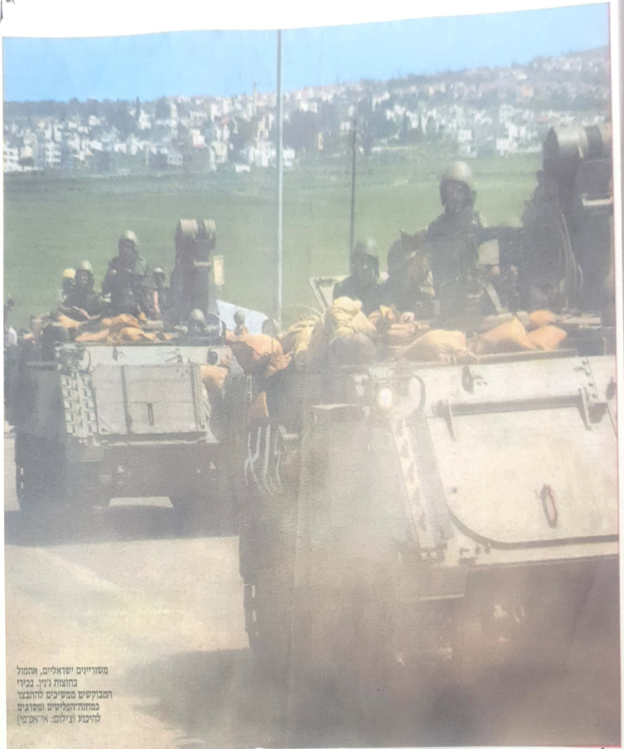
משוריינים ישראלים, אתמול בחוצות ג'ניו. בכירי המבוקשים ממשיכים להתבצר במחנה הפליטים ומסרבים להיכנע