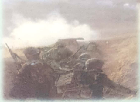
אימונים שלב ב'