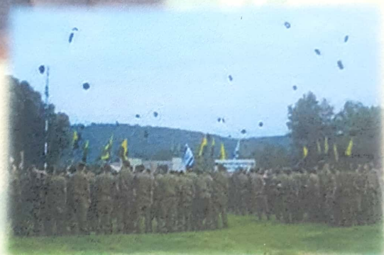
טקס קבלת כומתה