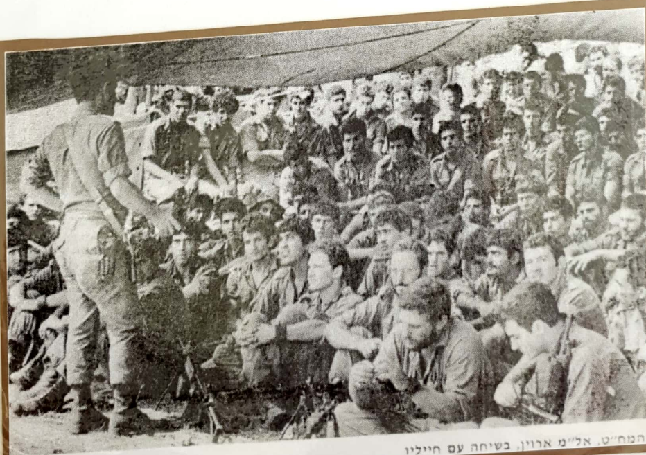
המח"ט אל"מ ארווין, בשיחה עם חייליו