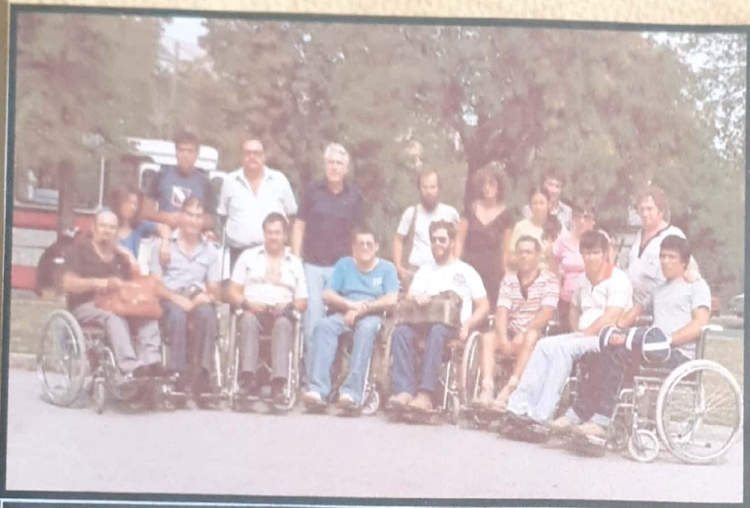
משלחת הספורט בבית-הלוחם בתל-אביב