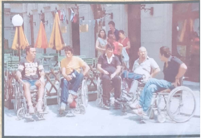
בינה במשחקי טניס אולימפיים