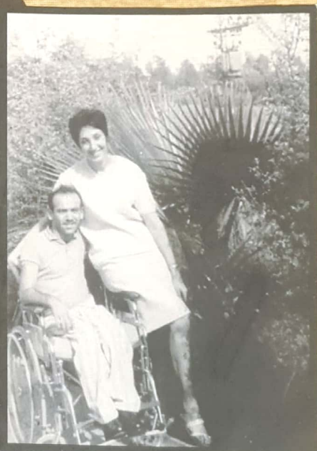
בשיקום בבית-חולים תל-השומר לאחר הפציעה