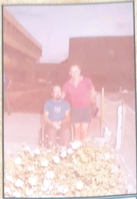
יזסי עם המאמן לסניס שולחן בבית-החולים

- ער בטר נפנת'י סאני אאס אסת כל יאי חיי אצק ארשלים עס צר וברחוב אקראת חיים חשים -