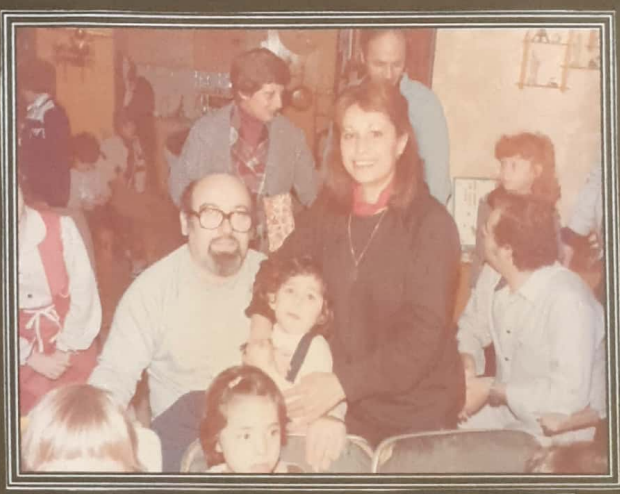
ביום-הולדת 3 של מיטל הבת הגבוהה