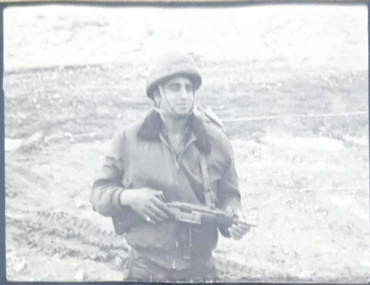
ליד טנק סורי שרוף זמן קצר לפני מותו ,