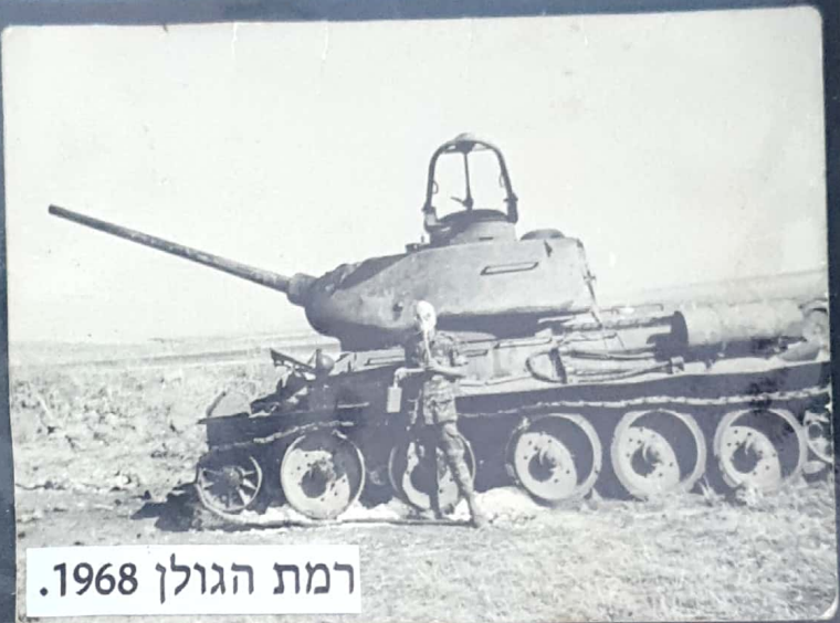
רמת הגולן 1968.