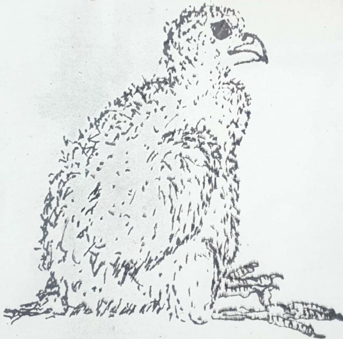
גוזלו של בן