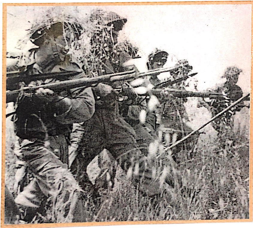
בשדה קוץ ודרדר. קיבוץ הגלויות של "נולני" בשנות ה-50 הראשונות באימוני שדאות.