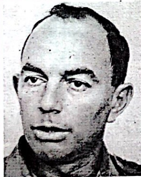
תת אלוף (מיל.) שדמי יששכר (ישכה)