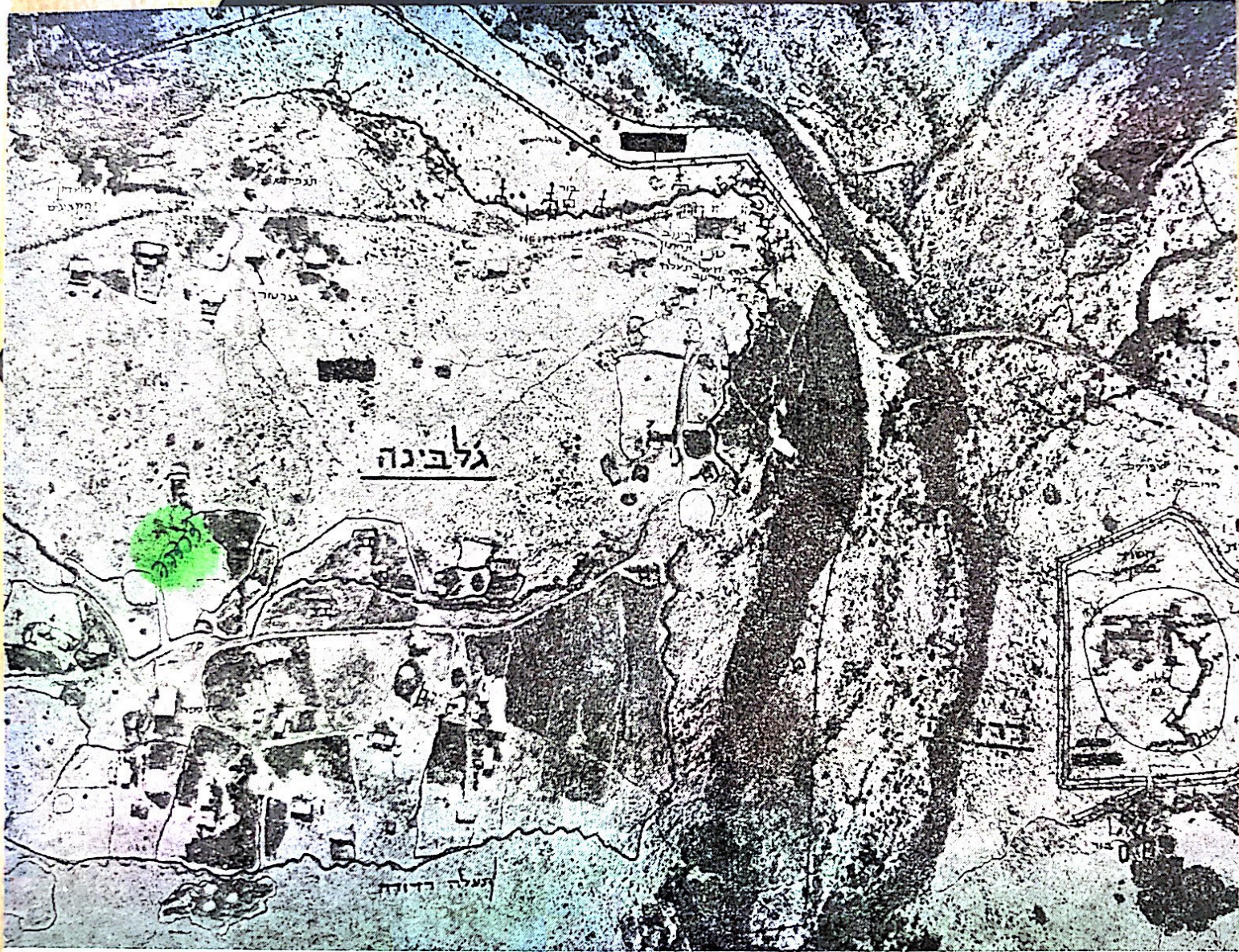
תצלום אוויר של דרדרה וג'לאבינה