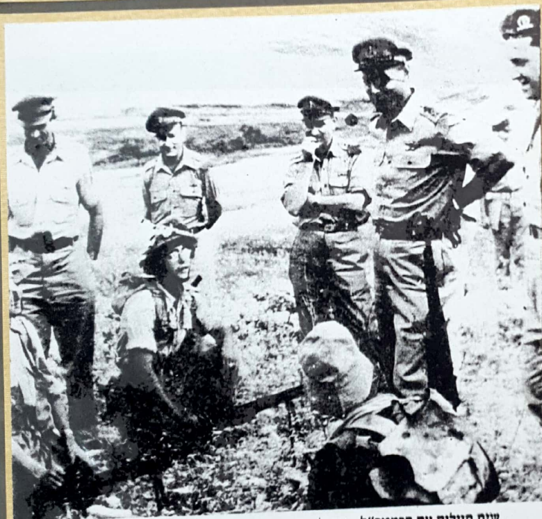
שיח חיילים עם הרמטכ"ל, רבי-אלוף משה דיין, ראש המטה הכללי, מבקר את חיילי "גולני" המתאמנים. בנוסף לגיבוש המסגרות המבצעיות של החטיבה שימשה "גולני" של שנות החמישים כוריהיתוך לקליטת עלייה.