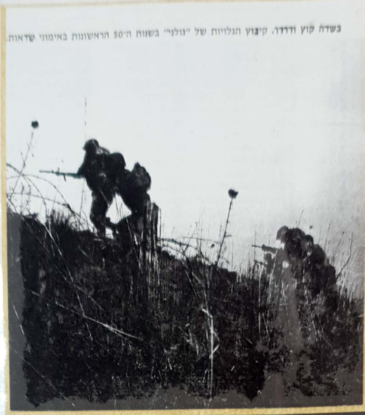
בשדה קוצ ודדדו. קיבוץ הגלילות של "גולני" בשנות ה-50 הראשונות באימוני שדאות.