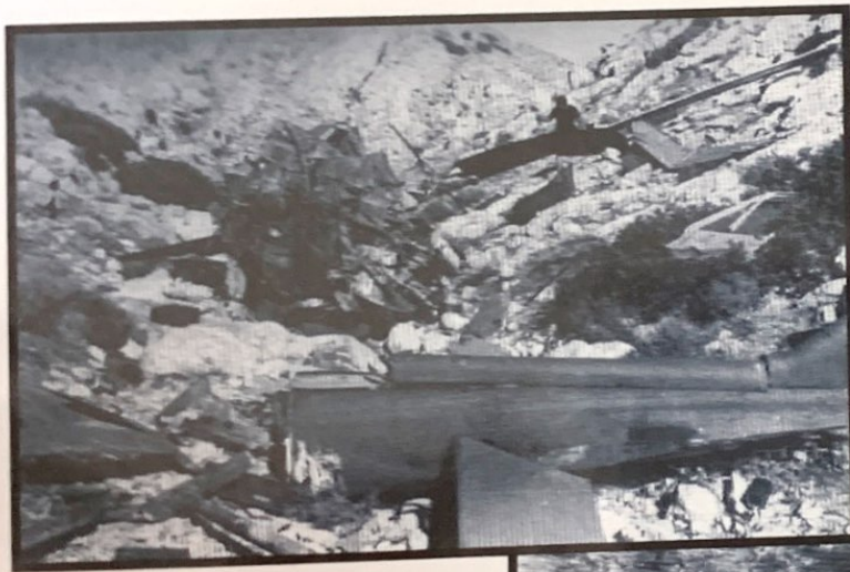
שברי המסוק בנחל בזק