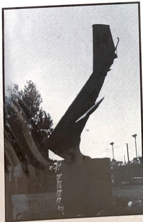
מציבה לחללי המסוק בתל-כביר, בתל-אביב

"יש חמישה הרוגים וחמישה פצועים. דרושה בדחיפות עזרה," פנה הרופא לקברניט נ'. הלה קירב את מכשיר הקשר הזעיר אל פיו וצעק בהתרגשות: "ריסוק מלא, חמישה הרוגים וחמישה פצועים." מישהו בקשר שאל אותו: "מה עם הכחולים, מה עם אנשי הצוות האווירי?" נ' התכעס על השאלה: "מה זה חשוב כעת? כל הכחולים מתים."