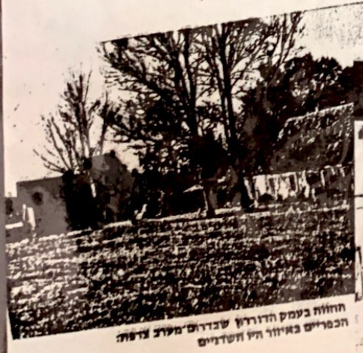
החווה בעמק הדורדון שבדרום מערב צרפת. הכפריים באיור היו חשונים

גם בעיות חברה לא חסרו. הכפריים באיור חשונים, אינם מתיידדים בקלות עם זרים.