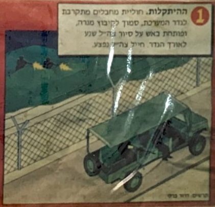
1 ההתקלות. חוליות מחבלים מתקרבות לגדר המערכת, סמוך לקיבוץ מגדוד ומתחת באש על סיור נהל שנו לאורך הגדר חייל צה"לי נפצע.