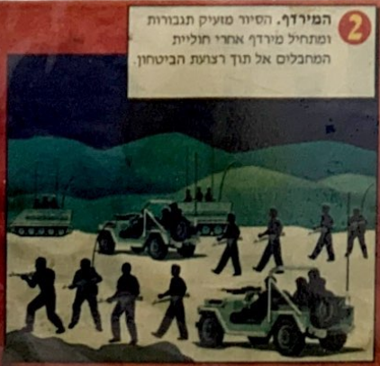
2 המירדף. הסיור מועיק תגבורות ומתחיל מירדף אחרי חוליות המחבלים אל תוך רצועת הביטחון.