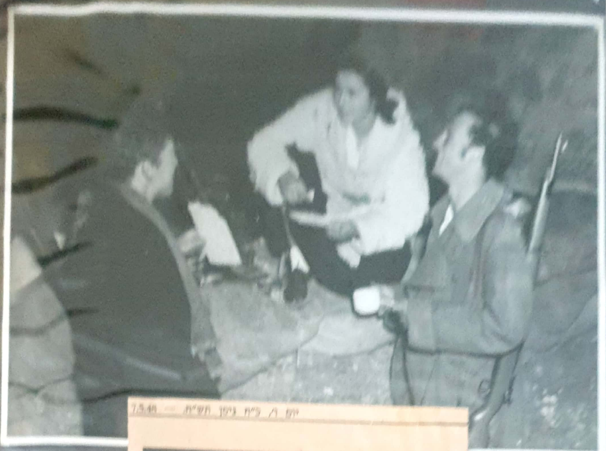
יום 7, ליל ניצן הע"מ - 7.5.48