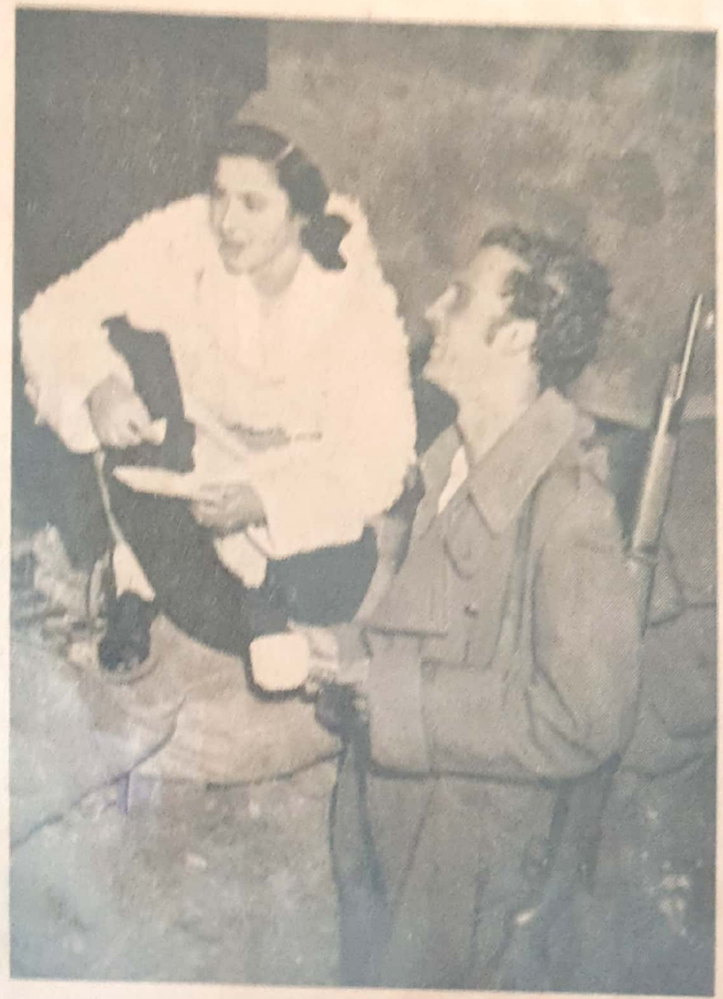
השחרחרת ממשורר העמק...