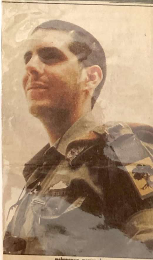
בן 22 במותו. הובא למנוחות בירושלים