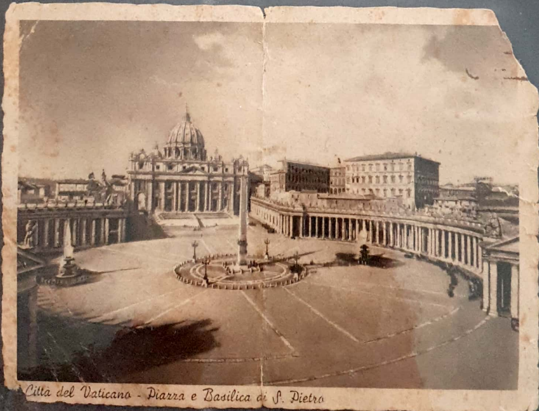
Citta del Vaticano - Piazza e Basilica di S. Pietro