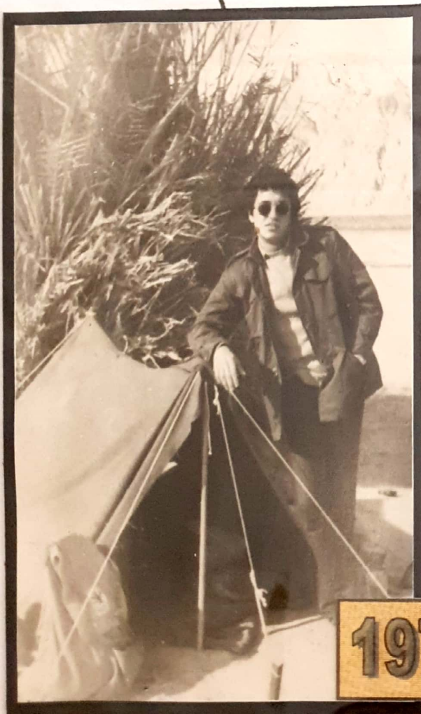
לפני הגיוס, שנת 1976