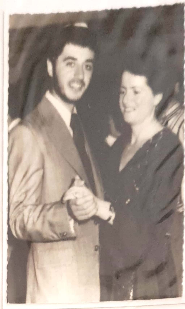
שלום ואימו בחתונת אחיו