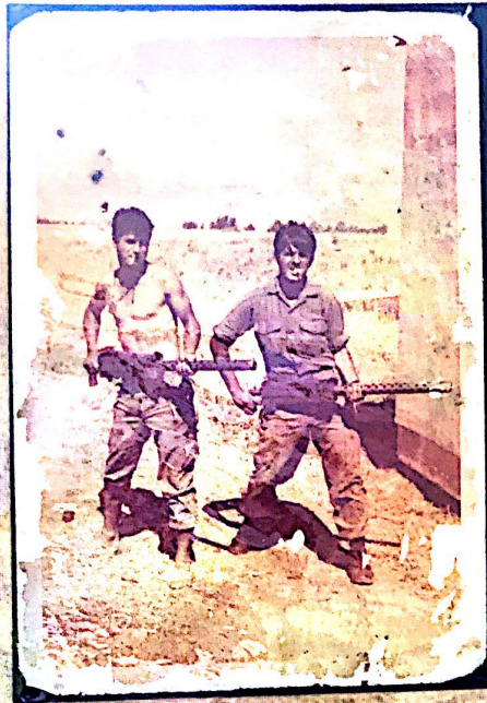
על גב התמונה כתוב:

"המלחמה כופח הקיום צה השלום המלחמה האמיתית לכן המלחמה אין מנצחים יש מובס ומנצח נכבס"