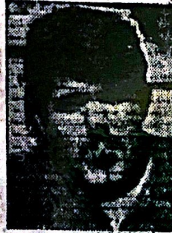
אלעזר אסור ז"ל

אבל בעיירה שלומי על מות החייל בקרב עם מחבלים בדרום-לבנון * אלפים ליווהו אחמוץ למנוחות