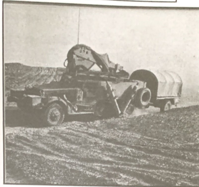
"עזרה ראשונה למכוניות" - צוות חימוש במנוחה לאחר עבודה מייגעת